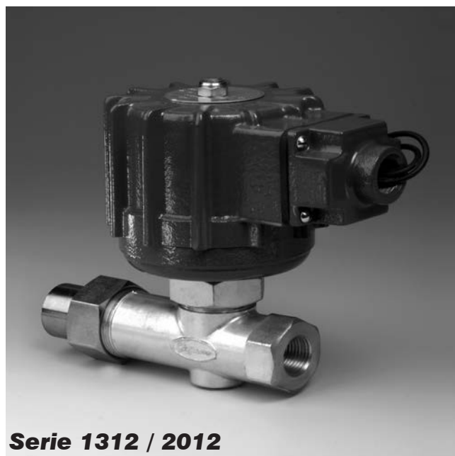
Serie 1312 / 2012